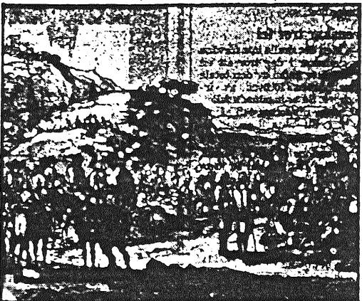
En episod från snapphanekriget tecknad av Johan Fredrik Lemke.

Det var därför med stor förvåning man lyssnade till ett TV-program den 25 november, där några s.k. amatörforskare gjorde gällande att Skånes försvenskning pågick ända fram till våra dagar och tydligtvis ännu pågår. Och detta trots att skåningarna nu i 300 år sänt sina representanter till den svenska riksdagen och ställt i svenska regeringar med den från ända